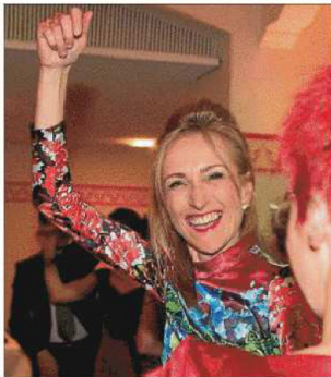
Ausgelassen war die Stimmung beim Lions Ball nicht nur bei dieser Dame.