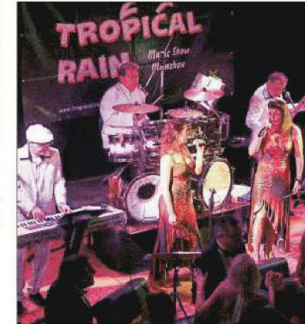
Die Band „Tropical Rain“ aus München gab unumstritten den Takt vor.