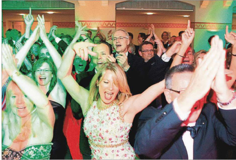
Nahezu ekstatisch tanzte so mancher durch die Ballnacht.