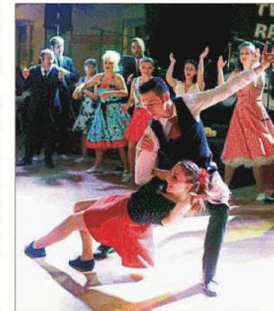
Heiße Sohle: die Boogie-Woogie-Gruppe Pink Panther des ETSV 09