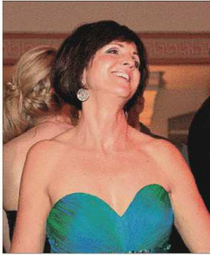
Bestens unterhalten fühlte sich offensichtlich auch diese Dame.